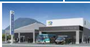
国分寺会館 高松市国分寺町柏原985-1