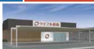
家族葬ホールライフル香南 香南町由佐805番地2