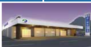
綾歌・飯山会館 丸亀市綾歌町富熊410