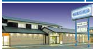
セレモニーホール綾川 綾歌郡綾川町菅原484 法道寺会館